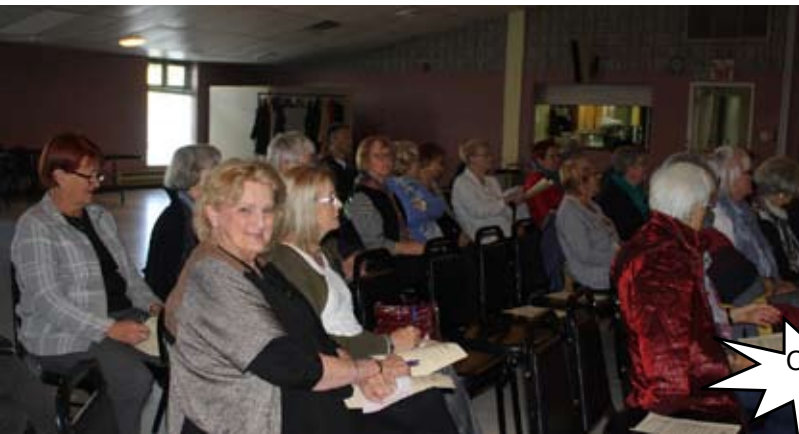
Conférence sur la santé mentale