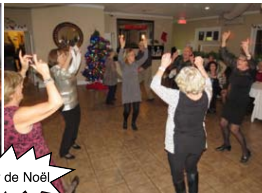
Souper de Noël