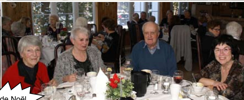
Dîner de Noël