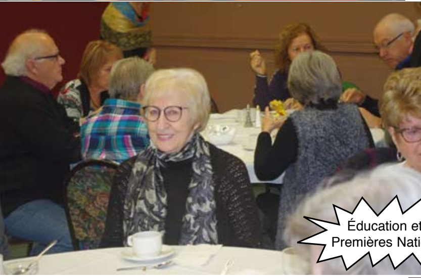
Éducation et Premières Nations