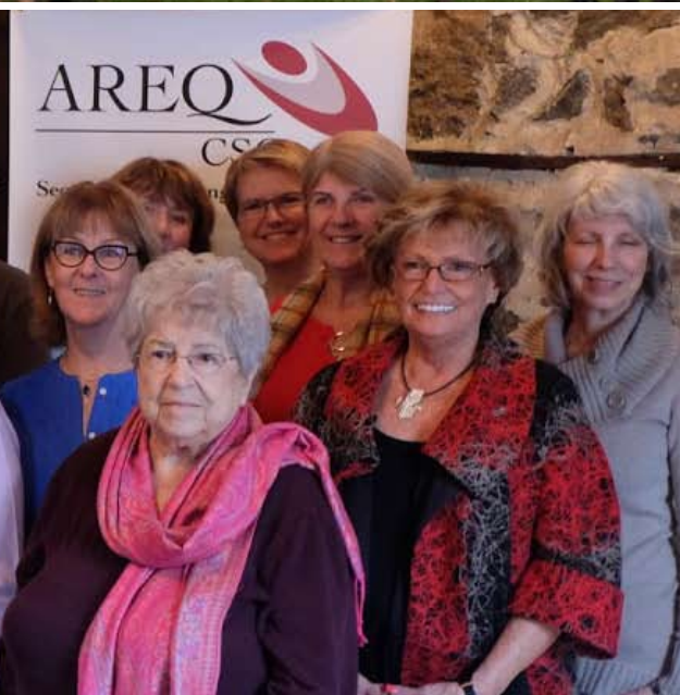
Dîner des nouveaux membres